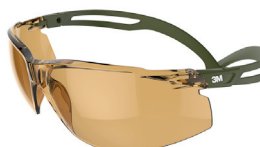
SF528SGAF-DGR 7100244062 Lens: Lichtbruin, SGAF Framekleur: Olijfgroen