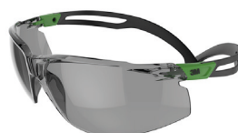
SF530ASP-GRN 7100243989 Lens: IR 3.0 Grijs, AS+ Framekleur: Groen en zwart