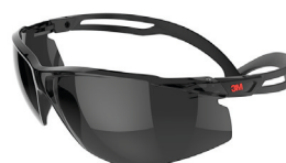
SF502SGAF-BLK 7100244201 Lens: Grijs, SGAF Framekleur: Zwart