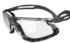
SF501SGAF-BLK-FM 7100243964 Lens: Helder, SGAF Framekleur: Zwart met verwijderbare foampakking