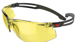
SF503SGAF-BLK 7100243980 Lens: Amber, SGAF Framekleur: Zwart