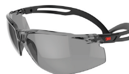
SF507SGAF-BLK 7100243995 Lens: Binnen/buiten grijs, SGAF Framekleur: Zwart