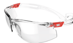
SF501SGAF-RED 7100243934 Lens: Helder, SGAF Framekleur: Helder en rood