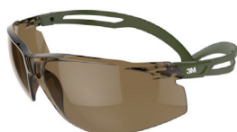
SF505SGAF-DGR 7100244022 Lens: Bruin, SGAF Framekleur: Olijfgroen