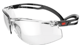
SF501SGAF-BLK 7100243142 Lens: Helder, SGAF Framekleur: Zwart