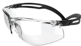
SF501ASP-BLK 7100243979 Lens: Helder, AS+ Montuurkleur: Zwart