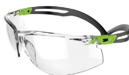
SF501SGAF-GRN 7100243971 Lens: Helder, SGAF Framekleur: Groen en zwart