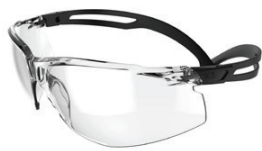
SF501AF-BLK 7100244045 Lens: Helder, AS/AF Montuurkleur: Zwart