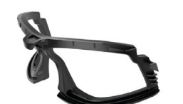
SF500-SCHUIM 7100243943 Foampakking accessoire