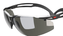
SF509AF-BLK 7100243963 Lens: Zilver spiegelend, AS/AF Montuurkleur: Zwart