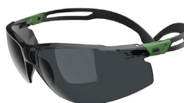
SF550ASP-GRN 7100243978 Lens: IR 5.0 Grijs, AS+ Framekleur: Groen en zwart